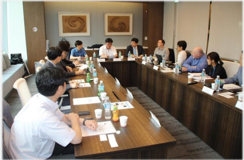
리튬에어배터리 국제공동연구 주제 IBM 초청간담회 (2015.06.05) - 참가기관 : IBM, KIPCC, 미래부, 서울대, 동국대, 한국화학연구원