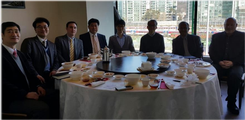
IBM-KIPCC 협력주제 미팅 오찬 (2015.02.13)