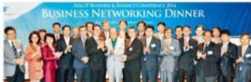
한국경제신문과 국제지식재산산업협회(IPCC)가 26일 서울 리즈호텔호텔에서 공동 주최하는 '아시아 IP 비즈니스 & 금융 콘퍼런스 2014'를 하루 앞두고 20일 열린 '비즈니스 네트워킹 디너' 행사에서 참석자들이 기념 촬영을 하고 있다.

캘러럼 콘서트 등 IP금융 전문가 한목소리 "시장 커지면 금리 떨어지고 거래 늘 것"