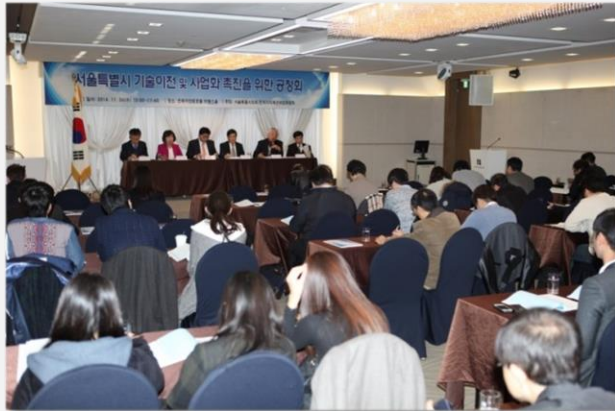
< 서울시 기술이전 및 사업화 촉진'을 위한 공청회 >