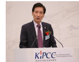
미래부 이상목 前차관