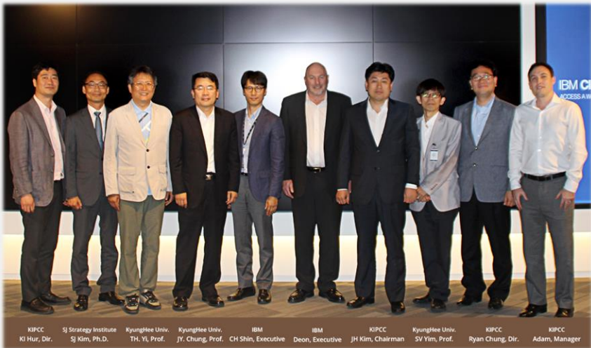
IBM-KIPCC-경희대 협력 주제 간담회 (2015.06.04)